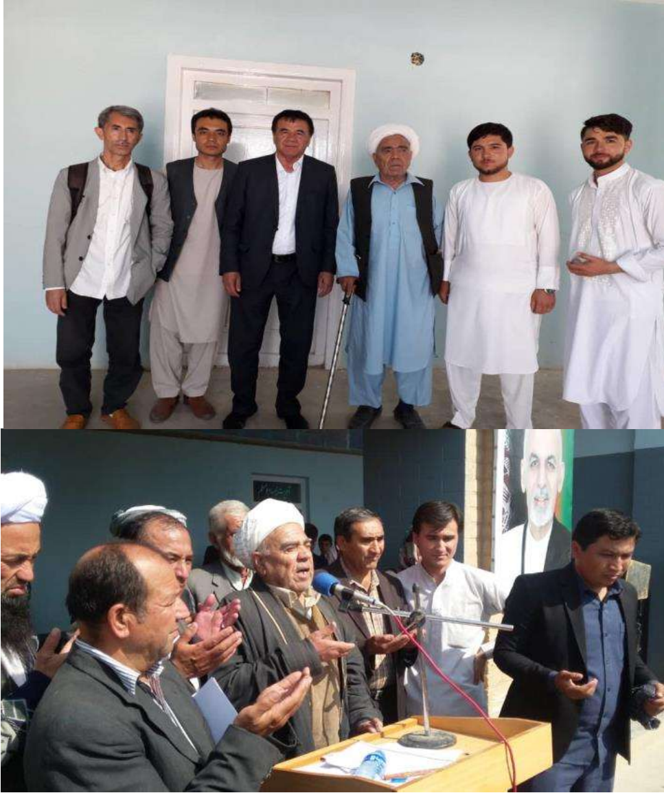
اندخويده يۇلگه قۇيىلگن فرهنگى احتفالدىن بىر رسم