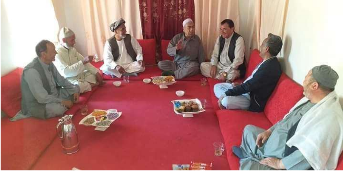
استاد مولانا محمداسحاق انور اندخوى فرهنگى شخصيتلىرى بيلن